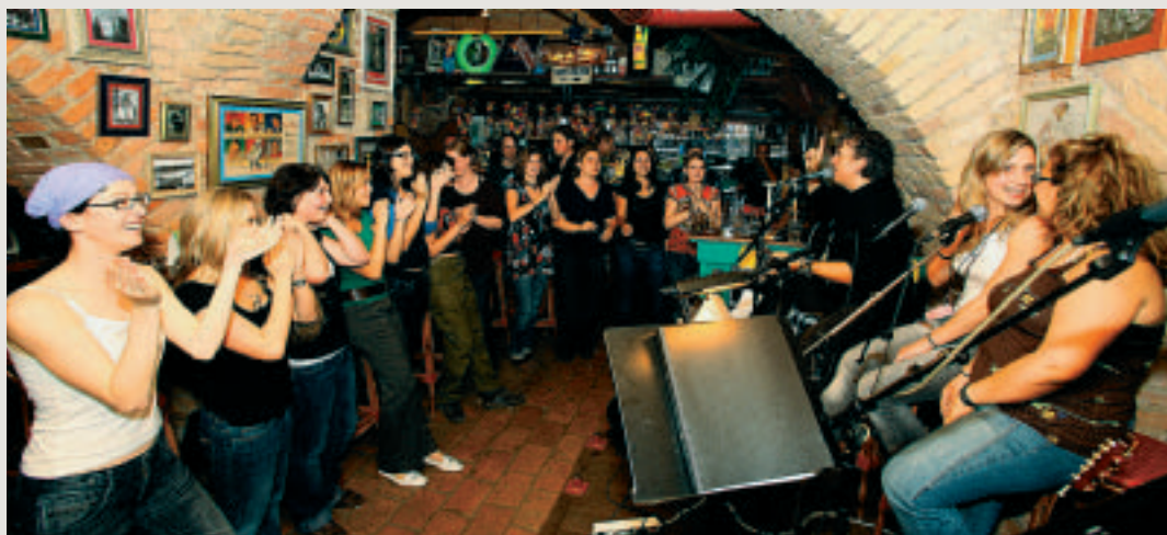
Live-Musikabende sorgen für gute Stimmung und Urlaubsfeeling.