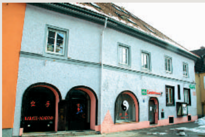
Bald nicht mehr wiederzuerkennen – Objekt Grazer Straße 5.